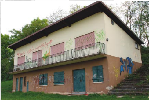
Im Domröschenschlaf liegt seit Jahren das alte Sportheim.