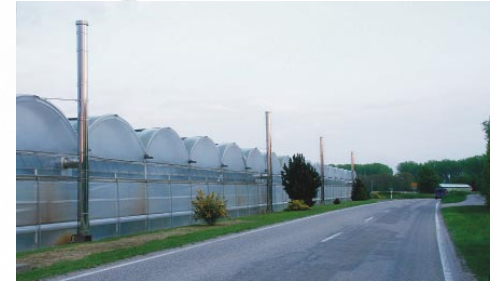
Kuhardt braucht mehr Gewerbe.