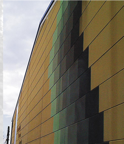
Solarenergie könnte man auch bei der Rheinberghalle nutzen. Das spart Heizkosten und Strom.