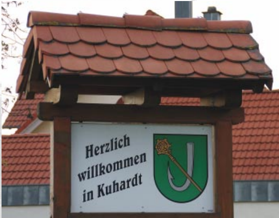
Herzlich willkommen in unserer SPD-Broschüre!