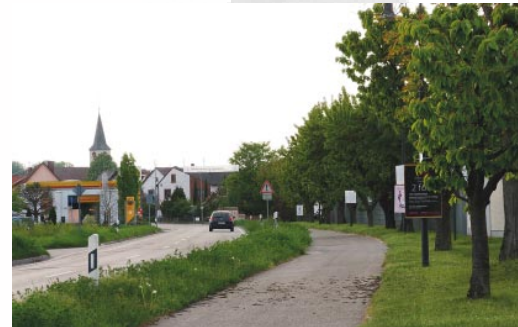
Hier braust der Durchgangsverkehr ungebremst in unser Dorf hinein.