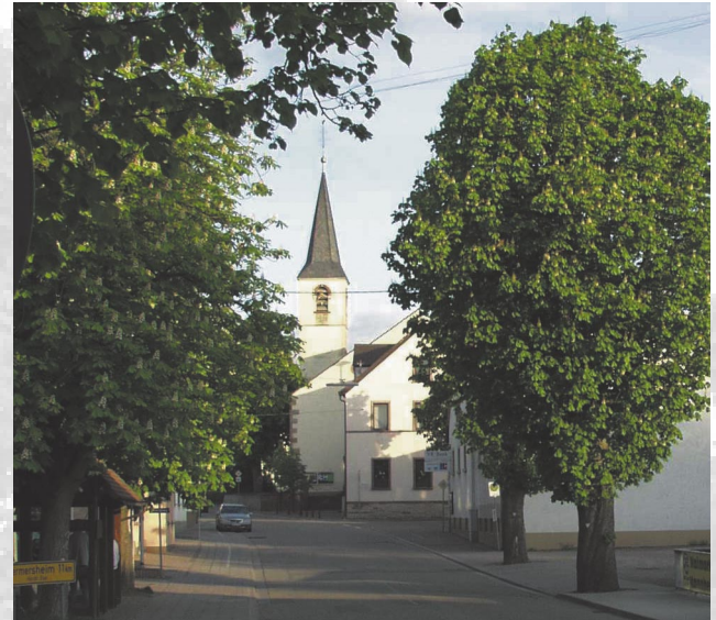
Unser Dorf braucht mehr Entwicklung.

Schaffung von Sitzmöglichkeiten Sozialer Treffpunkt für Jung und Alt