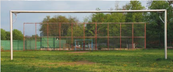
Hier wäre Platz und Raum für Freizeitmöglichkeiten.

Gewerbegebiete sind die Voraussetzung für Arbeitsplätze und Steuereinnahmen