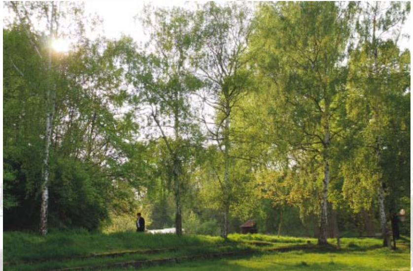
Kuhardt ist lebenswert. Dafür setzen wir uns ein.

Trotzdem sehen wir noch nicht alle Möglichkeiten ausgeschöpft und erkennen die Notwendigkeit bestimmte Projekte anzugehen. Die Verkehrsberuhigung hat dabei für uns besonders hohe Priorität.